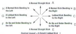
Tableau de changement de direction pour une courbe ascendante

En supposant que le joueur remonte le terrain en courant et botte le ballon, la courbe ascendante appliquée à un tir fonctionnera de la façon suivante : Plus une courbe est appliquée rapidement à un tir, plus elle sera accentuée.